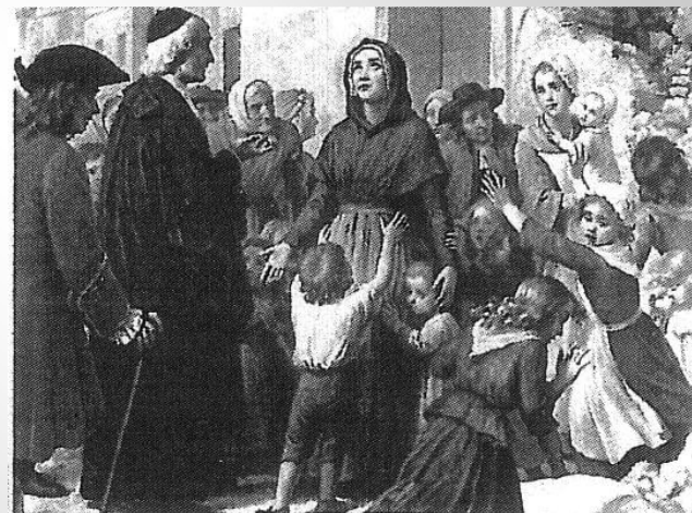
1703 : éboulement du coteau

Messe de Ste-Jeanne Delanoue Samedi 27 Octobre 2007 à 11 h 00 à la Maison-Mère de la Communauté