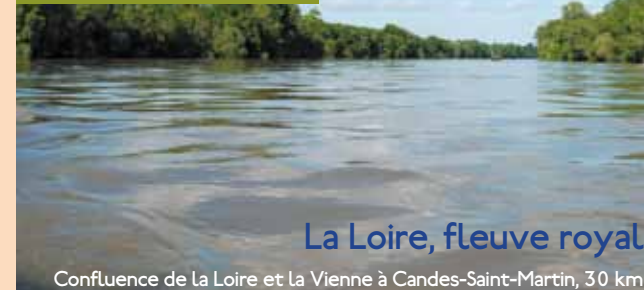
La Loire, fleuve royal

Confluence de La Loire et La Vienne à Candes-Saint-Martin, 30 km