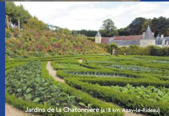
Jardins de La Chatonniers (à 18 km, Azay-Le-Rideau)