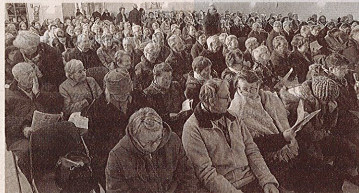
Les pèlerins à l'accueil Notre Dame.

nombreux bénévoles est nécessaire : ils régulent la circulation ayant parfois affaire à des conducteurs pas très patients.